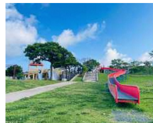
いこいの市民パーク