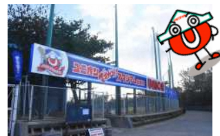
ユニオンですからスタジアム宜野湾 ※導入事例（令和6年2月）

市民サービスの向上に繋がりますので、企業の社会的責任（地域貢献）が高まり、イメージアップが図れます。